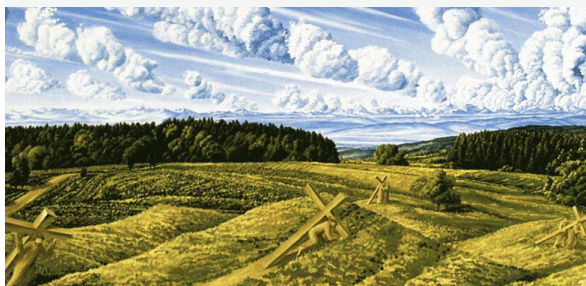
©Elmar Hillebrand (Künstler), Kreuzweg - Pfarrkirche in Limpach/Deggenhaustertal