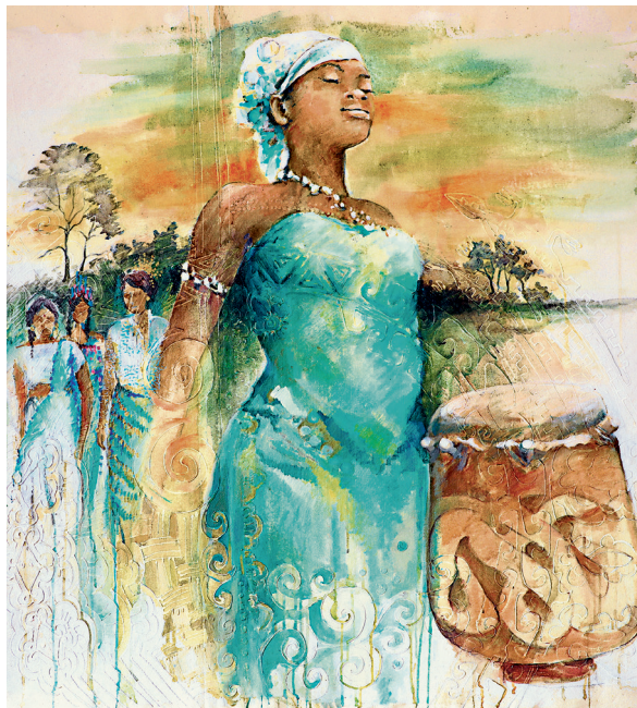
© Weltgebetstag der Frauen/Dt.Komitee e.V. Bildtitel: Gran tangi gi Mama Aisa, Künstlerin: Sri Irodikromo