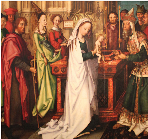
Darstellung des Herrn; Hans Holbein der Ältere 1501, Kunsthalle Hamburg